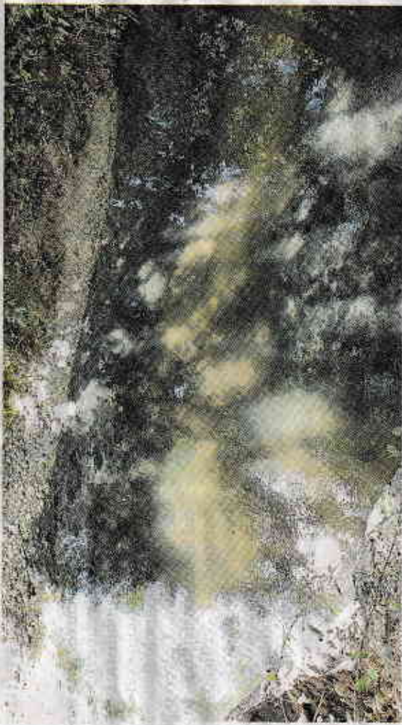
L'affluente inquinato del Monticano sulle colline di Ogliano

«C'era un odore di fogna e il fondale nero, probabilmente per sostanze derivate da residui di lavorazioni e pulizie di