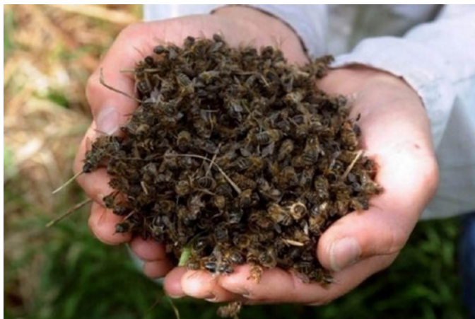
Api morte nel maggio 2019 a Musile in Veneto a causa dei diserbanti

Le api non solo producono il miele, ma sono essenziali per l'impollinazione dei fiori e per la produzione della frutta.